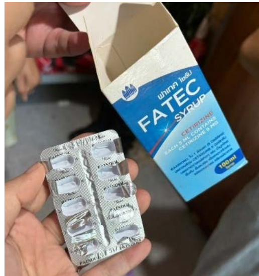
กรณีที่ 2 ผลิตภัณฑ์ยาที่นำมาเป็นส่วนผสมของน้ำดื่มกระเทียม