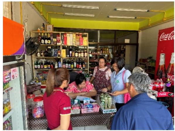
พนักงานเจ้าหน้าที่ ตาม พ.ร.บ. ยา พ.ศ. 2510 เข้าตรวจสอบเรื่องร้องเรียนกรณีร้านชำขายยา ترامาดอล