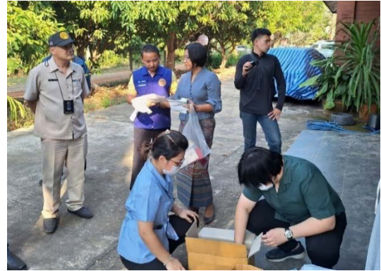
กรณีที่ 2 สถานที่ผลิตน้ำดื่มกระเทียมผสมยาแก้แพ้ ยาแก้ปวดที่ไม่ได้รับอนุญาต