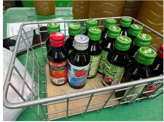
กรณีที่ 3 ผลิตภัณฑ์ยาที่นำมาเป็นส่วนผสมของน้ำดื่มกระท่อม