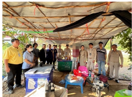
กรณีที่ 2 สถานที่จำหน่ายน้ำดื่มกระเทียมผสมยาแก้แพ้ ที่ไม่ได้รับอนุญาต