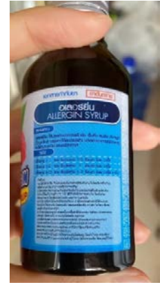
กรณีที่ 1 ผลิตภัณฑ์ยาที่นำมาเป็นส่วนผสมของน้ำดื่มกระเทียม