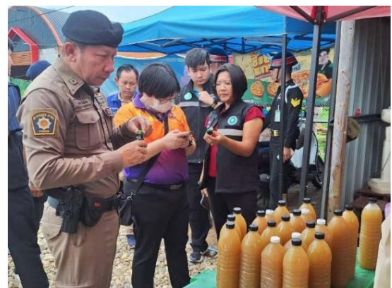
กรณีที่ 3 สถานที่จำหน่ายน้ำดื่มกระเทียมผสมยาแก้แพ้ ยาแก้ไอ และหัวน้ำเชื่อม