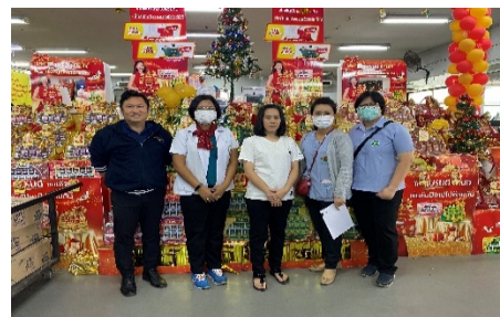
กิจกรรม ออกตรวจสถานประกอบการประจำปีด้านฉลาก ร่วมกับ สคบ.จังหวัดอุตรดิตถ์ 4 ครั้ง /ปี