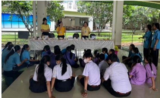
ฐานที่ 4 ฐานโภชนาการ และการปรับพฤติกรรมอาหาร

-อบรมรุ่นที่ 2 ในวันที่ 12 กรกฎาคม 2567 เวลา 08.30 -16.30 น. ณ ห้องประชุมไกรลาสวิทยา โรงเรียนไกรลาสวิทยา อำเภอน้ำปาด จังหวัดอุตรดิตถ์ จำนวนผู้เข้ารับการอบรม 112 คน