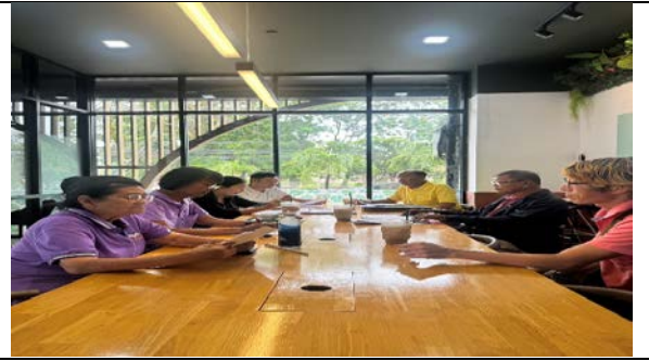
ภาพกิจกรรม การประชุมให้ความรู้และเตรียมความพร้อมพัฒนาชมรมคุ้มครองผู้บริโภคให้เข้าสู่การเป็นตัวแทนสภาองค์กรผู้บริโภค วันที่ 31 ก.ค.67 ณ ม.ราชภัฏอุตรดิตถ์