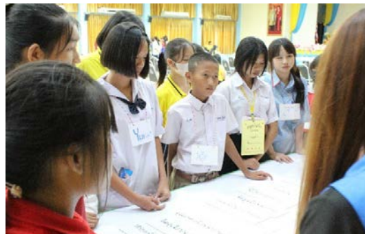
ฐานที่ 2 ความรู้เรื่องฉลากอาหาร และฉลากโภชนาการ และผลิตภัณฑ์สุขภาพ