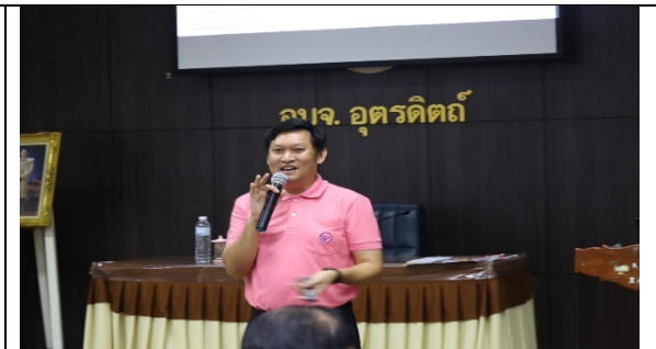
ภาพกิจกรรม อบรมและให้ความรู้เครือข่าย ชมรมผู้บริโภคฯ วันที่ 15 ส.ค. 67 ณ ห้องประชุมองค์การบริหารส่วนจังหวัดอุตรดิตถ์ อ.เมืองอุตรดิตถ์ จ.อุตรดิตถ์