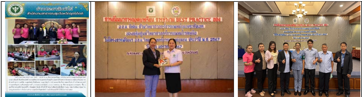
ภาพกิจกรรม ประกวด อสม.นักวิทยาศาสตร์การแพทย์ชุมชน ระดับภาคเหนือ วันที่ 18 มกราคม 2567 ณ โรงแรมแพร่นครา อ.เมือง จ.แพร่

สำนักงานสาธารณสุขจังหวัดอุตรดิตถ์ โดยกลุ่มงานคุ้มครองผู้บริโภคและเภสัชสาธารณสุขได้ประสานความร่วมมือ และเป็นพี่เลี้ยงที่ปรึกษา ให้แก่พื้นที่ระดับ อำเภอ และตำบลและ อปท.มาอย่างต่อเนื่อง