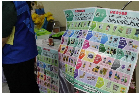
ฐานที่ 1 ความรู้เรื่องยา และผลิตภัณฑ์สุขภาพในร้านขายของชำ