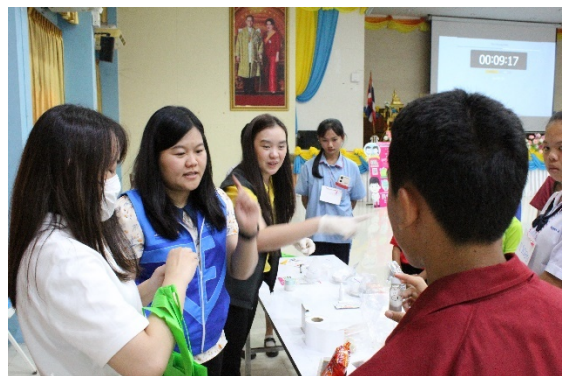
ฐานที่ 3 สารปนเปื้อนในอาหาร และ เครื่องสำอาง และ ยาสมุนไพรผสมสเตียรอยด์