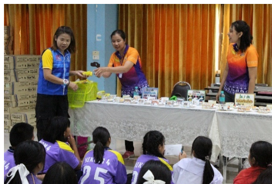
ฐานที่ 4 ความรู้ด้านโภชนาการ และการปรับพฤติกรรมอาหาร

3. กิจกรรมการทดสอบความรู้ ก่อนและหลัง สำหรับผู้เข้ารับการอบรมทั้ง 2 รุ่น โดยใช้แบบทดสอบจาก กองพัฒนาศักยภาพผู้บริโภค สำนักงานคณะกรรมการอาหารและยา